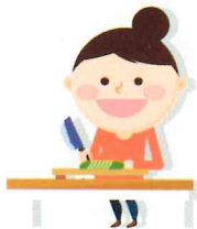
올바른 영양 및 식생활 관리 방법