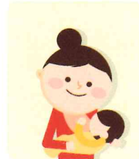
모유수유, 이유식 진행 방법